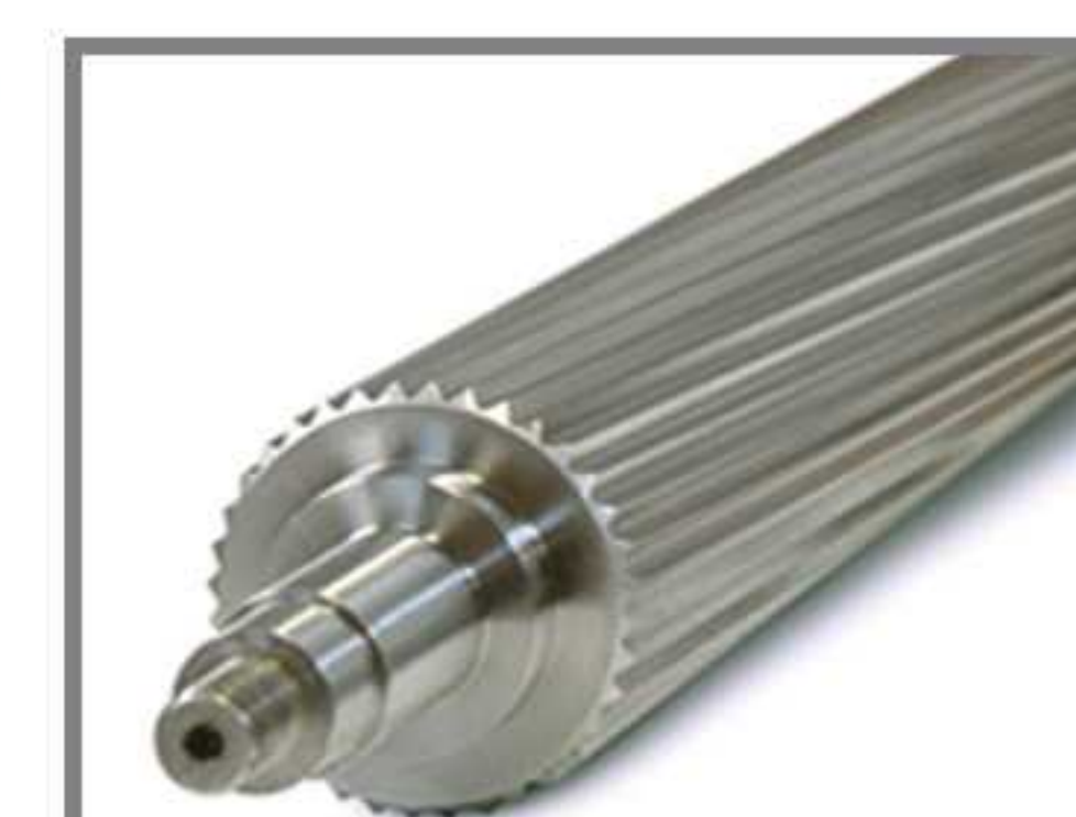
غلطک تغذیه مارپیچ