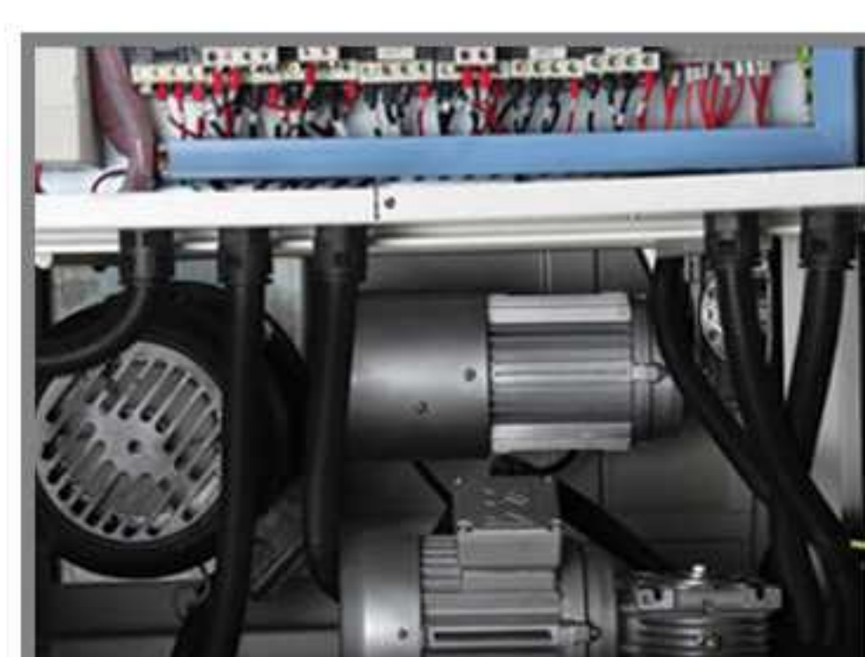
موتور پر قدرت