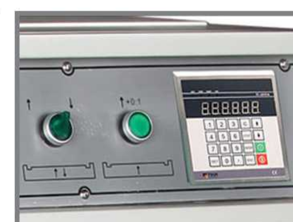
دارای دو حالت کنترلی