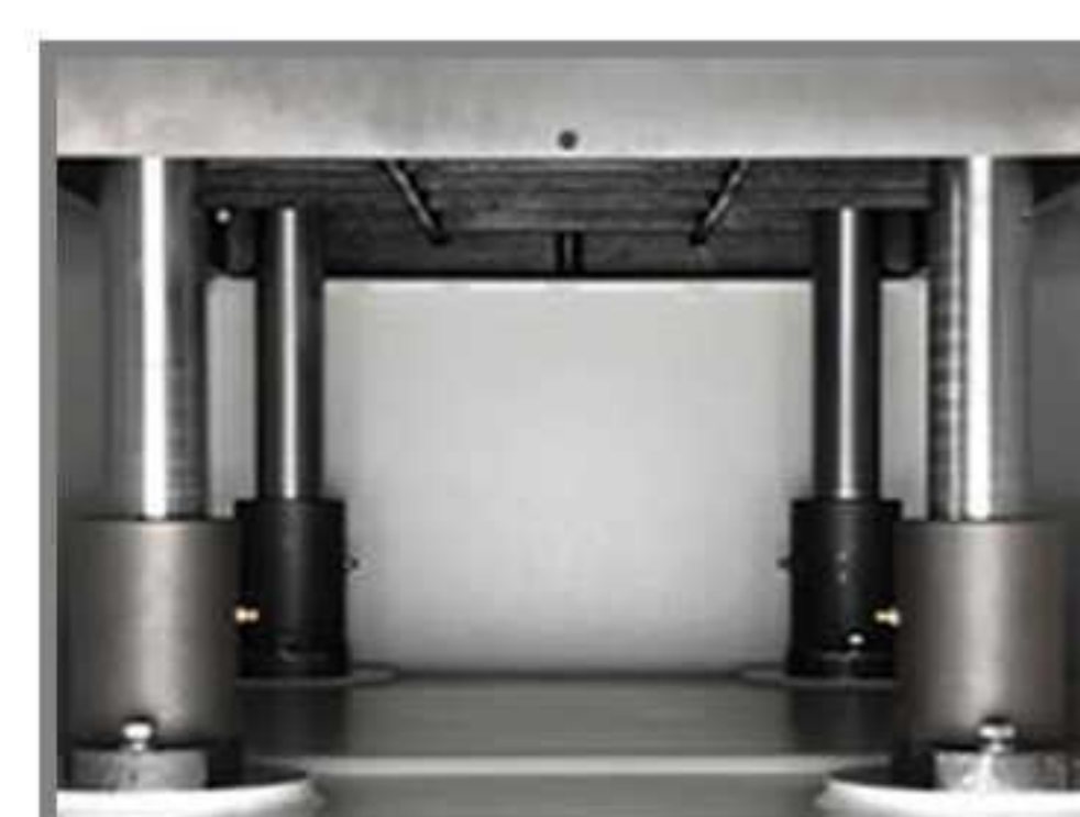
۴ جک پر قدرت